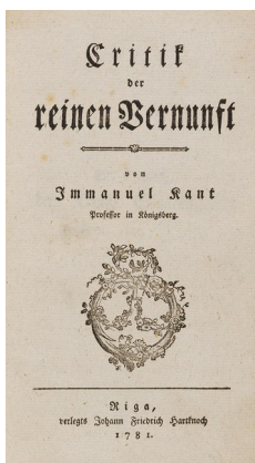
Immanuel Kant Critik der reinen Vernunft, 1781. Schätzpreis: € 12.000 Ergebnis: € 22.500