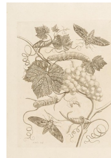
Maria Sibylla Merian De Europische Insecten. Angebunden: Surinaamsche Insecten, 1730. Schätzpreis: € 30.000 Ergebnis: € 45.000