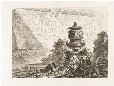
Giovanni Battista Piranesi Vedute di Roma. (Rom 1748-1769). Schätzpreis: € 60.000 Ergebnis: € 65.000