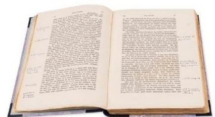
Martin Heidegger Sein und Zeit. Exemplar von Gilbert Ryle, 1926. Schätzpreis: € 2.500 Ergebnis: € 20.625