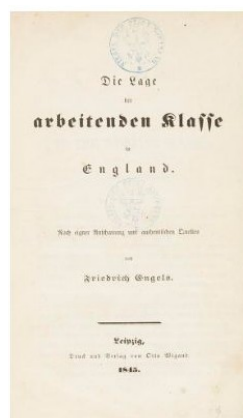
Friedrich Engels Die Lage der arbeitenden Klasse in England, 1845. Schätzpreis: € 5.000 Ergebnis: € 21.500