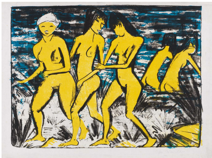
OTTO MUELLER Fünf gelbe Akte am Wasser. 1921. Farblithografie. 33,5 x 43,8 cm. € 9.000–12.000

Für Bildanfragen erreichen Sie uns unter presse@kettererkunst.de