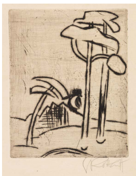
KARL SCHMIDT-ROTLUFF Bäume und Mond. 1923. Radierung. 17,8 x 13,8 cm. € 2.000–3.000