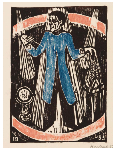
ERICH HECKEL Zauberer (22. Jahresblatt). 1952. Farbholschnitt. 18,2 x 12,4 cm. € 1.000–2.000