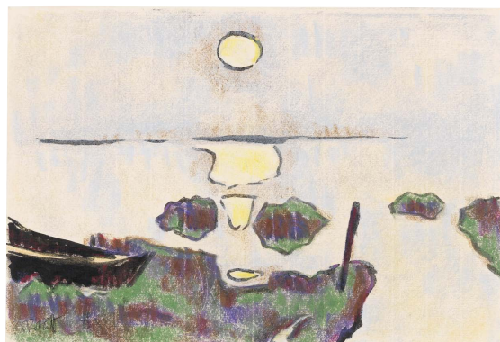
KARL SCHMIDT-ROTLUFF Mondaufgang überm See. Ca. 1940/1942. Farbige Kreide. 26,9 x 38,1 cm. € 3.000–4.000