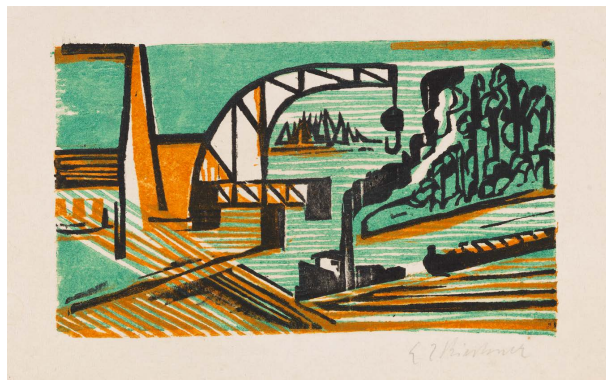
ERNST LUDWIG KIRCHNER Flusslandschaft mit Kran und Schleppzug. 1927/1928. Farbholschnitt. 10,3 x 17,2 cm. € 3.000–3.500