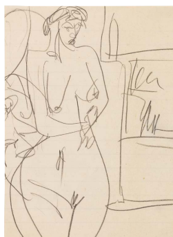
ERNST LUDWIG KIRCHNER Stehender Akt. 1915. Bleistiftzeichnung. 20,3 x 14,4 cm. € 3.000–5.000