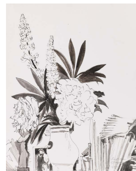
ERICH HECKEL Lupinen und Pfingstrosen. 1959. Tuschzeichnung. 68,9 x 52,5 cm. € 3.000–5.000