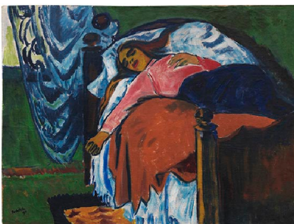
Hermann Max Pechstein Die Ruhende, 1911.

Außerdem werden noch weitere Werke internationaler Maler gezeigt. Darunter sind so prominente Künstler wie der Ire Sean Scully, der Schweizer Louis Soutter, die Amerikanerin Cindy Sherman und der Deutsche Ernst Wilhelm Nay.