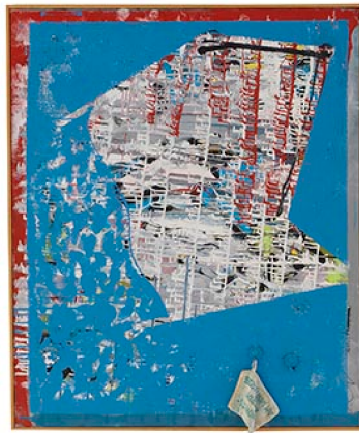
Martin Kippenberger Gruga-Bad, 1982.