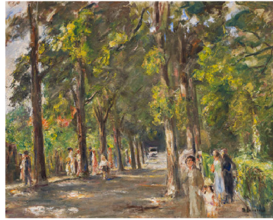
Max Liebermann Große Seestraße in Wannsee, Um 1925.