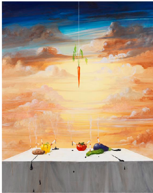
George Condo The Life We Love, 2004.