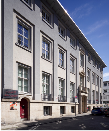
Gertrudenstr. 24 – 28, Köln