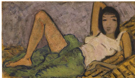
Otto Mueller Mädchen auf dem Kanapee, 1914