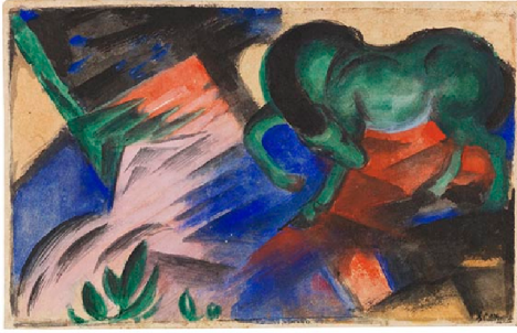
Franz Marc Grünes Pferd, 1912.